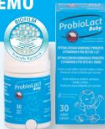
DOPLŇEK STRAVY S PROBIOTIKY

Doplňek stravy ProbioLact Baby je určený pro děti od 3 let. Obsahuje vyvážený komplex 10 probiotických kmenů živých mikroorganismů a vitamin D pro správnou funkci imunitního systému. Vitamin D také přispívá ke zdravému stavu kostí a zubů. Bakterie Lactobacillus acidophilus biofilm a Bifidobacterium lactis biofilm jsou zpracovány unikátní technologií do formy tzv. biofilmu . Je vhodný při užívání antibiotik a při cestování.